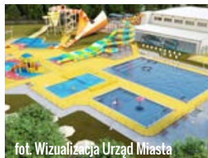
fot. Wizualizacja Urząd Miasta

własnego, co pozwoliłoby rozstrzygnąć pierwszy przetarg i ruszyć z robotami.