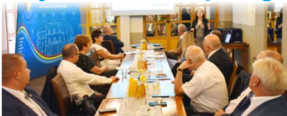
KONWENT STAROSTÓW WOJEWÓDZTWA ŚLĄSKIEGO