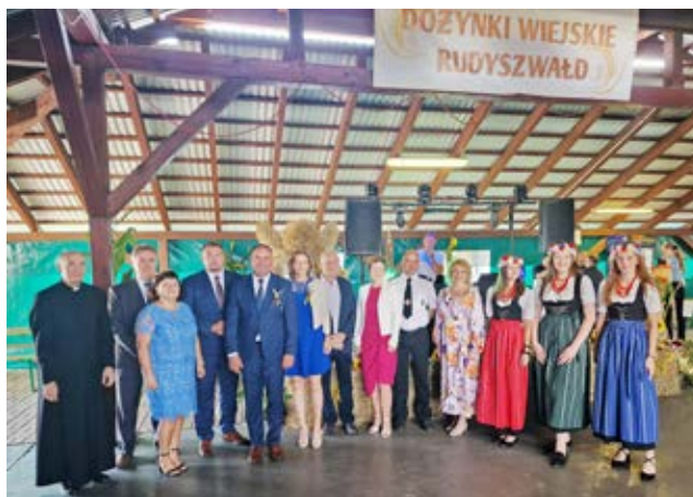
Święto plonów w Rudyszwałdzie.