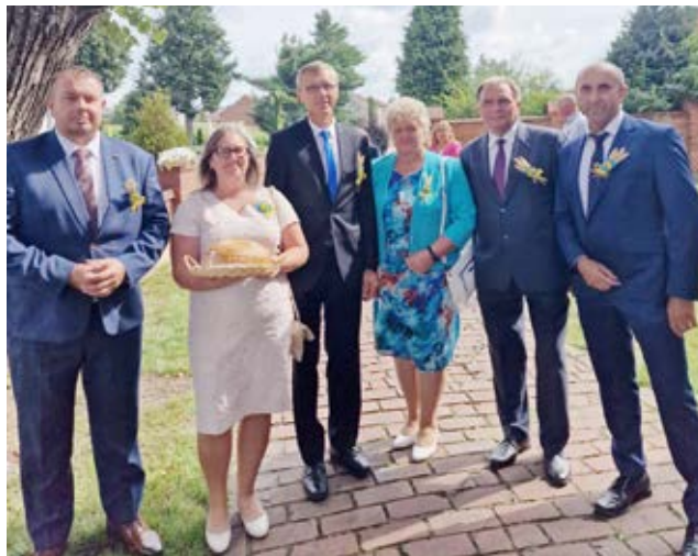
W Pietrowicach Wielkich w sołectwie Cyprzanów odbyły się Dożynki Gminne.