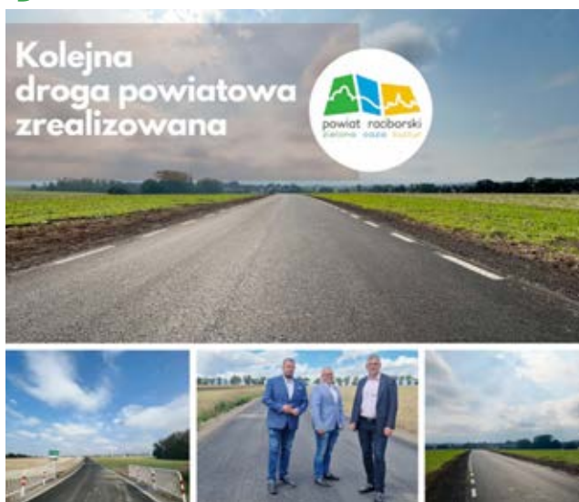
nr 59 do drogi wojewódzkiej nr 416”, które jest realizowane w ramach Rządowego Fundu-

W/w rozbudowa jest częścią zadania „Przebudowa drogi powiatowej nr 3548S w Raciborzu od Placu Konstytucji 3 Maja do ul. Gwiaździstej, od ul. Wandy do rejonu skrzyżowania z ul. Sejmową i od skrzyżowania z ul. Węgierską do działki nr 106 oraz rozbudowa drogi powiatowej nr 3548S w Raciborzu od działki