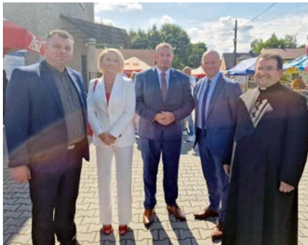
Dożynki sołectw Owsiszczach - Nowa Wioska.