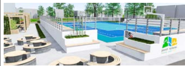
Wizualizacja obiektów przy LO II, fot. Starostwo Powiatowe