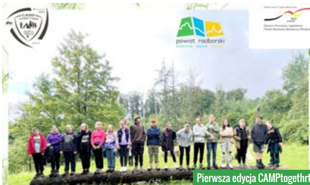
Pierwsza edycja CAMPtogether