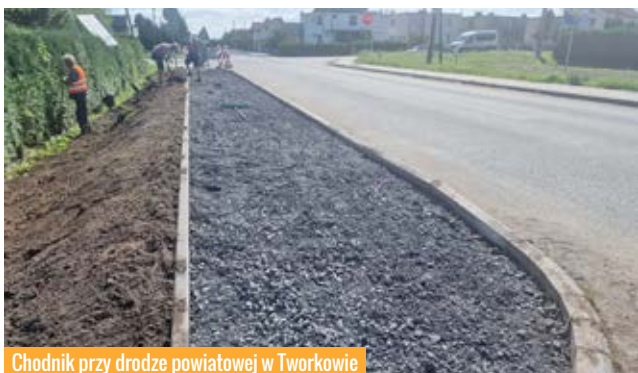
Chodnik przy drodze powiatowej w Tworkowie