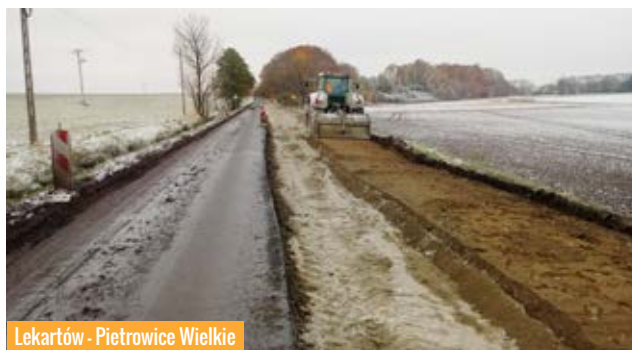
Lekartów - Pietrowice Wielkie