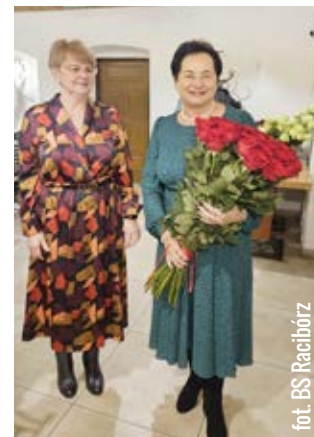
fol. BS Racibórz

- Przechodzę na zasłużoną emeryturę po 50 latach kierowania bankiem. Nadszedł czas na refleksję i podsumowanie ważnej części mojego życia. W trakcie mojej kariery zawodowej byłam uczestnikiem wielu przemian dotyczących bankowości spółdzielczej, która zawsze była bliska mojemu sercu. Wielu z Państwa miałam okazję i przyjemność poznać osobiście oraz współpracować przez wiele lat. Szczególnie cenię sobie Państwa profesjonalizm i zaangażowanie w okresach nieustannych wyzwań dotyczących sektora bankowości spółdzielczej, którym musieliśmy sprostać. Razem tworzyliśmy miejsca oparte na wartościach spółdzielczości, dbając o dobro klientów i wspierając lokalne inicjatywy. Dziękuję wszystkim z którymi miałam okazję współpracować, za okazywane zaufanie, wsparcie i motywację