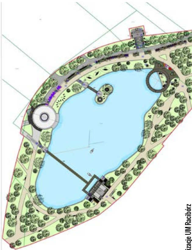
wizualizacje UM Racibórz

- Wprowadzając rewitalizację Parku Roth, nie tylko odświeżamy nasze miasto, ale także wpisujemy się w ogól-