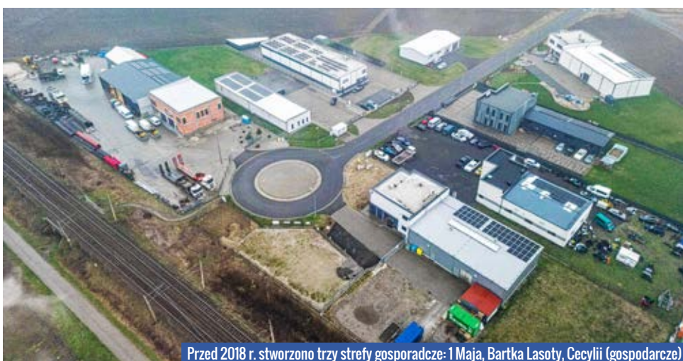
Przed 2018 r. stworzono trzy strefy gospodarcze: 1 Maja, Bartka Lasoty, Cecylii (gospodarcze)