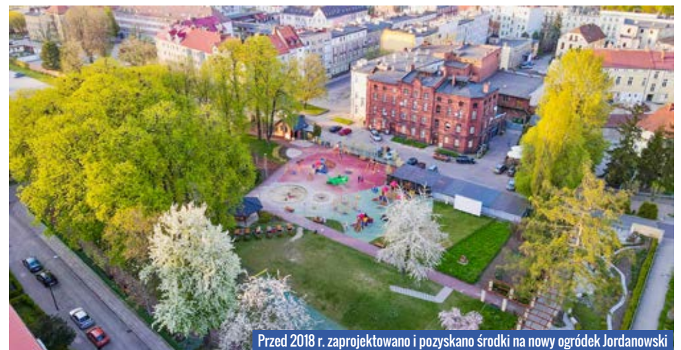
Przed 2018 r. zaprojektowano i pozyskano środki na nowy ogródek Jordanowski