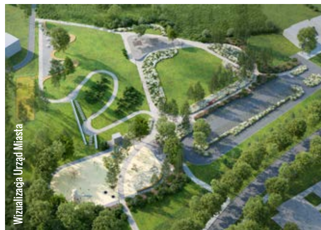
Wizualizacja Urzędu Miasta