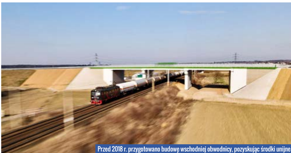
Przed 2018 r. przygotowano budowę wschodniej obwodnicy, pozyskując środki unijne