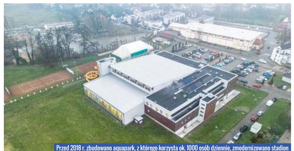
Przed 2018 r. zbudowano aquapark, z którego korzysta ok. 1000 osób dziennie, zmodernizowano stadion