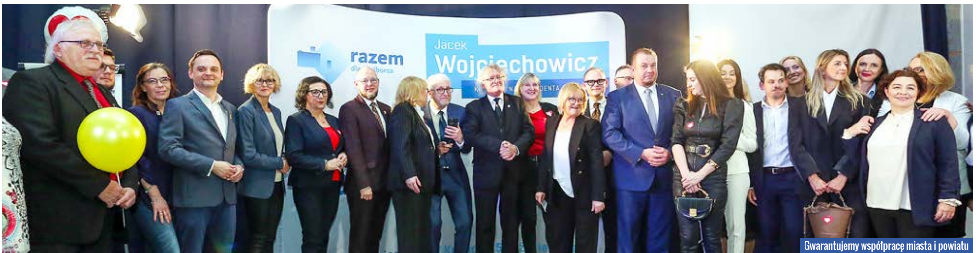
Gwarantujemy współpracę miasta i powiatu