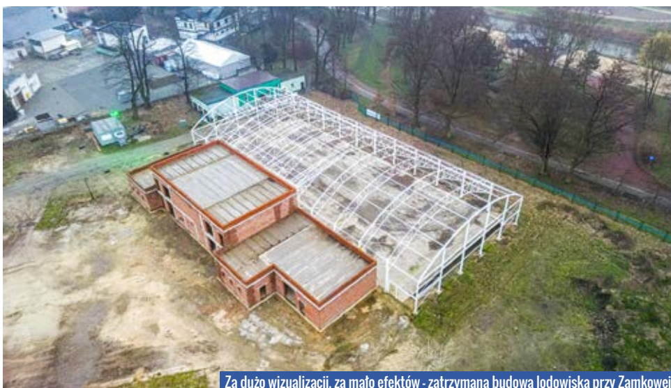
Za dużo wizualizacji, za mało efektów - zatrzymana budowa lodowiska przy Zamkowej

Trzy na szynach – tak, wbrew fałszywej propagandzie sukcesu, podsumowałbym efekty działań społeczno-gospodarczych obecnego prezydenta. Powinna to być ostatnia ocena, jaką otrzyma. Na kolejne sześć lat budowania „wielkiego Raciborza” nasze miasto nie może już sobie pozwolić. To byłyby kolejne zmarnowane lata.