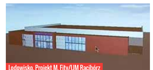
Lodowisko, Projekt M. Fity/UM Racibórz