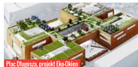
Plac Długosza, projekt Eko-Okien