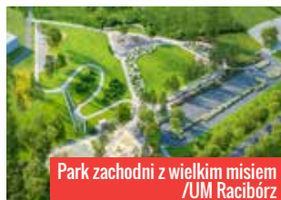
Park zachodni z wielkim miśm