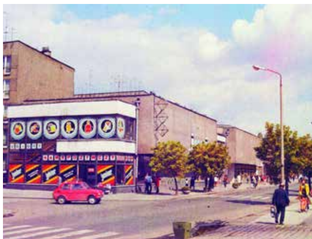
Mam ogromny sentyment do dawnego Raciborza. Opawską pamiętam jako reprezentacyjny trakt, z licznymi sklepami, pełną ludzi. Trzeba jej przywrócić świetność