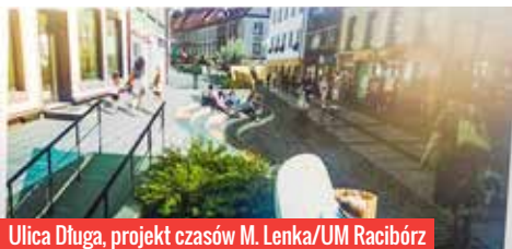
Ulica Długa, projekt czasów M. Lenka/UM Racibórz

Lodowisko. Śledząc spory pomiędzy radnymi a prezydentem można odnieść wrażenie, że nie było ważniejszej sprawy dla wielkiego Raciborza jak ślizgawka. Klócono się o dach (radni za normalnym, prezydent za namiotowym) i wielkość tafli (radni za pełnowymiarową, prezydent za rekreacyjną). W pewnym momencie strony się dogadały, kasę do budżetu wpisano, ale jak to często bywało w tej kadencji, prezydent posłuchał sam siebie, porozumienie zламаł, za co radni cofnęli finansowanie. Lista wzajemnych oskarżeń jest długa. Nie ma starego Piastora, jest niedokończony lodowisko przy parku