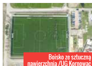
Boisko ze sztuczną nawierzchnią

Zamkowym oraz sądowe nakazy zapłaty. Są też trzy wizualizacje: jedna Fity i dwie Polowego. Druga Polowego, dotycząca budowy pełnowymiarowego lodowiska z przebudową kręgielni, kosztowała 80 tys. zł. Tylko prezydent wie po co ją zlecał. Chyba nikt nie wie, z o nią teraz zrobić.