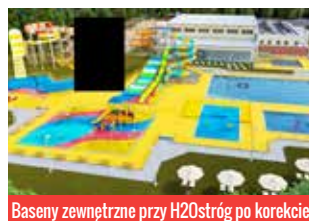
Baseny zewnętrzne przy H2Ostróg po korekcie