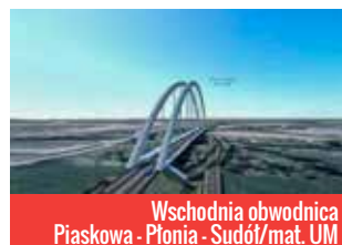
Wschodnia obwodnica Piaskowa - Płonia - Sudół