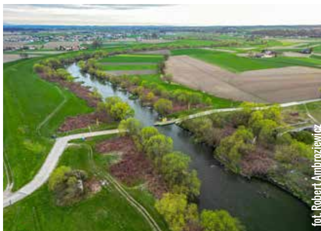
Zarząd Dróg Wojewódzkich w Katowicach przystąpił do budowy mostu na wysokości Ciechowic-Grzegorzowice, już dziś istnieje potrzeba skorelowania go z układem komunikacyjnym Raciborza poprzez remont DW 915