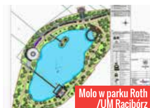
Molo w parku Roth /UM Racibórz