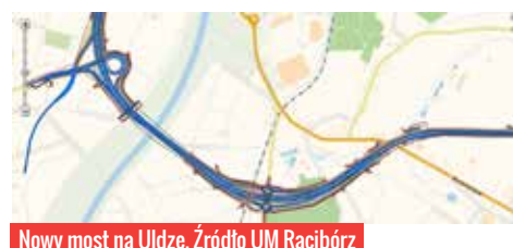
Nowy most na Uldze