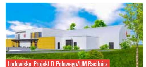
Lodowisko, Projekt D. Polowego/UM Racibórz