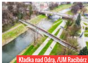
Kładka nad Odrą