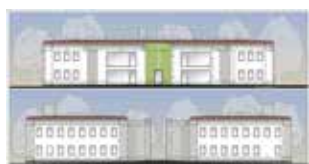
Wizualizacja żłobka przy Słonecznej