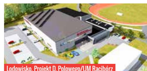
Lodowisko, Projekt D. Polowego/UM Racibórz