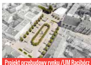
Projekt przebudowy rynku