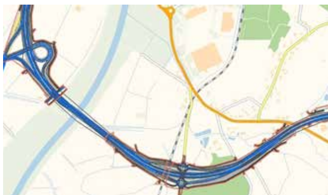
Węzeł Piaskowa, most na Uldze oraz włączenie do układu komunikacyjnego Brzeska (droga Racibórz-Lubomia) i Rybnicka DW 935 (droga Racibórz-Kornowac-Rybnik), źródło esim Racibórz

ku 4.00) pozwolą uniknąć korków. Przy wylaniu wykonawców inwestycji drogowych chcę położyć nacisk na jakość i szybki termin realizacji. W zakresie organizacyjnym zamierzam wzmocnić kadrowo Wydział Dróg Miejskich. Miasto nie potrzebuje etatów propagandystów, lecz fachowców od dróg, którzy szybko i sprawnie poprowadzą postępowania dokumentacyjne oraz przetargowe, a także zapewnią koordynację prac, tak by uniknąć uciążliwości dla kierowców. Jest wiele pilnych dróg do remontów, m.in. Waryńskiego czy Lotnicza.