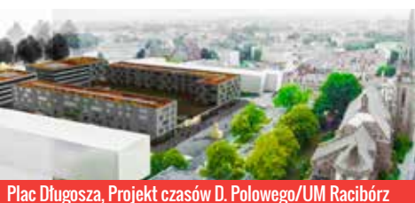
Plac Długosza, Projekt czasów D. Polowego/UM Racibórz