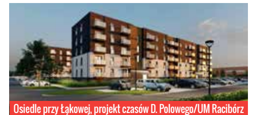
Osiedle przy Łąkowej, projekt czasów D. Polowego/UM Racibórz