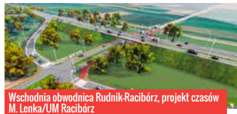
Wschodnia obwodnica Rudnik-Racibórz, projekt czasów M. Lenka/UM Racibórz