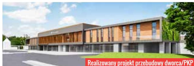
Realizowany projekt przebudowy dworca/PKP