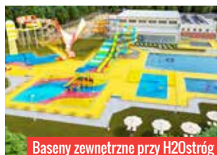
Baseny zewnętrzne przy H2Ostróg