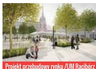
Projekt przebudowy rynku