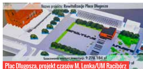
Plac Długosza, projekt czasów M. Lenka/UM Racibórz