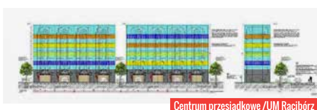
Centrum przesiadkowe