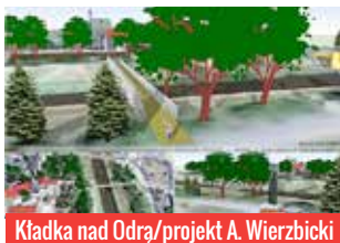
Kładka nad Odrą/projekt A. Wierzbicki