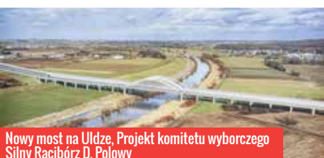
Nowy most na Uldze, Projekt komitetu wyborczego Silny Racibórz D. Polowy