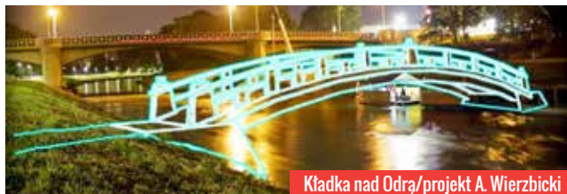
Kładka nad Odrą/projekt A. Wierzbicki