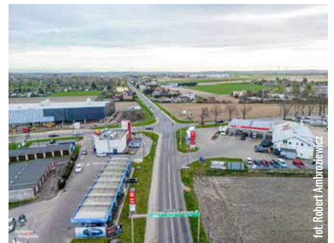
Skrzyżowanie na mycie, odwieczny problem korków, trzeba w końcu wybrać rozwiązanie (rondo albo prawoskręty) i przystąpić do działania