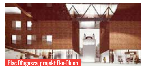
Plac Długosza, projekt Eko-Okien