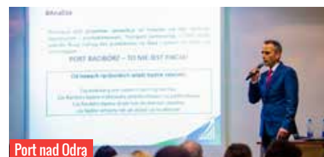
Port nad Odrą