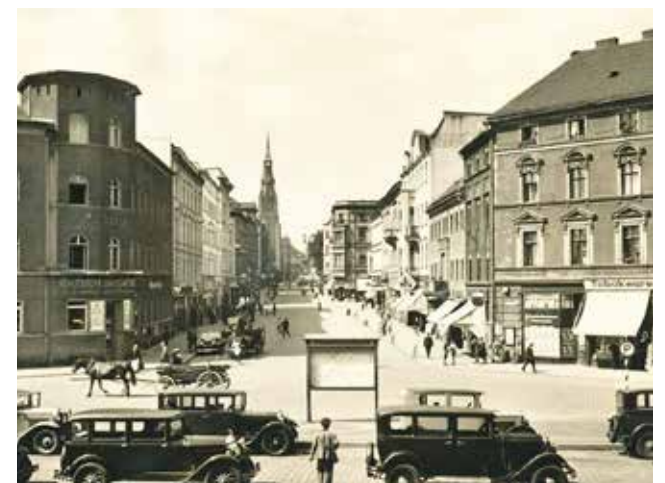
Sentymentalnie, ale sięgajmy do dobrych wzorców, tak jak dawniej Mickiewicza powinna znów przypominać reprezentacyjną arterię w mieście