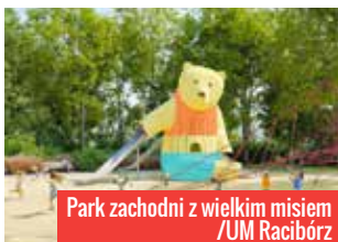
Park zachodni z wielkim miśm