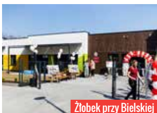
Żłobek przy Bielskiej