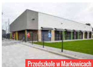
Przedszkole w Markowicach