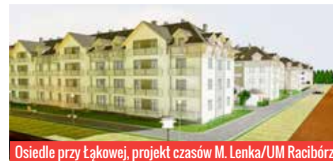
Osiedle przy Łąkowej, projekt czasów M. Lenka/UM Racibórz