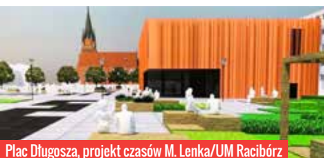
Plac Długosza, projekt czasów M. Lenka/UM Racibórz