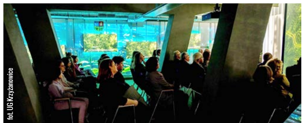
fol. UG Krzyżanowice