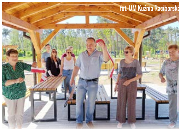
fol. UM Kuźnia Raciborska

Racibórz » Wartość projektu zrealizowanego przez miejscowej szkole to 357 183,81 złotych.