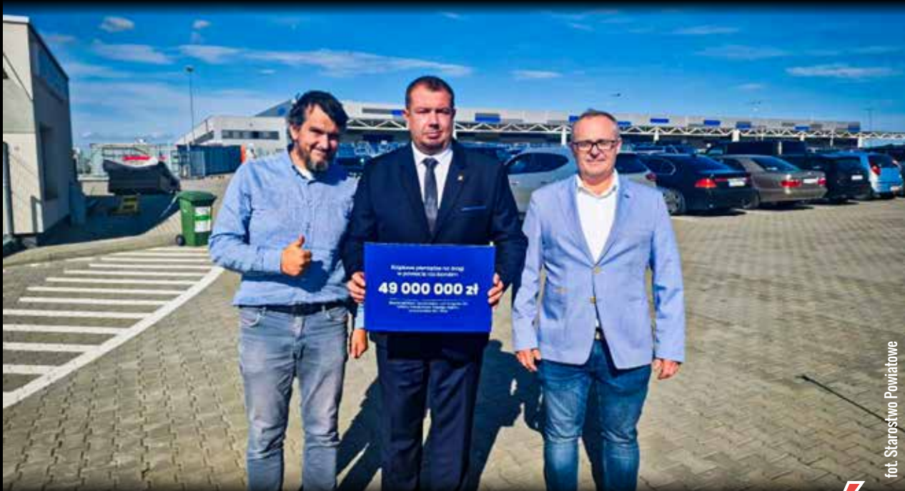
fol. Starostwo Powiatowe

Racibórz » Inwestycja warta blisko 50 mln zł finansowana jest z programu Polski Ład. Kierowcy muszą się liczyć z utrudnieniami, ale w efekcie otrzymają nowoczesny układ komunikacyjny wokół największego pracodawcy w powiecie, o dużym natężeniu ruchu.