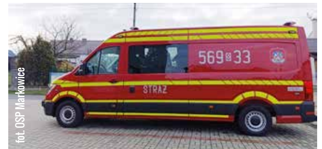
fol. OSP Markowice

Nowy pojazd znacząco zwiększy możliwości operacyjne jednostki, zapewniając szybszą i skuteczniejszą pomoc mieszkańcom regionu.