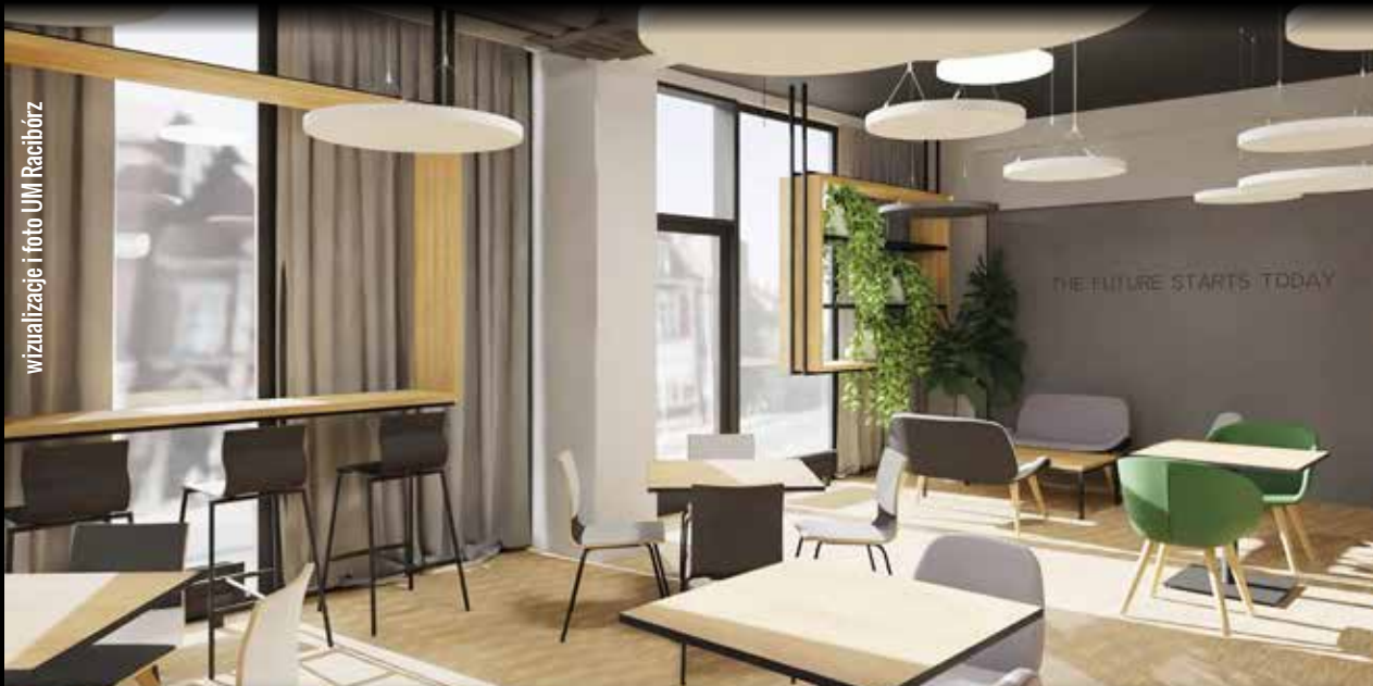
wizualizacje i foto UM Racibórz

Racibórz » 31 stycznia odbyło się uroczyste przekazanie placu budowy w ramach zadania "Zagospodarowanie pomieszczeń na dworcu PKP w Raciborzu". Klucze do obiektu odebrała firma Texom sp. z o.o. z Krakowa, która wykona adaptację pomieszczeń pod Urban Lab Racibórz. Po 120 dniach Racibórz zyska nowoczesną przestrzeń innowacji i współpracy.